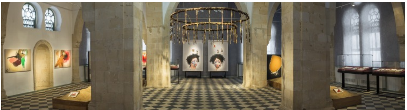
[1] אניסה אשקר, "זהב שחור", 2017 מבט הצבה