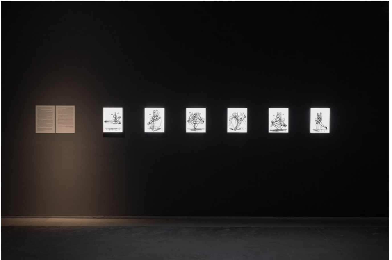
[13] ניר עברון, פאנגימנסטיקון, 2016. מראה הצבה, מוזיאון תל אביב, 2016. עיצוב חלל: דן חסון. צילומי הצבה: אלעד שריג

לבסוף, ב- La Solitude מ-2016 מוצגים קטעים מצולמים מגיאנה הצרפתית, מקום ששימש במאה ה-19 ועד מחצית המאה ה-20 מושבת עונשין של צרפת. הסרט נפתח בתא הכליאה של אלפרד דרייפוס, שנשלח לשם ב-1894, וממשיך בין אתריה השונים של הטריטוריה. המתכנת הכמו-תיעודית מראה את המקומיים וכפריהם, את בירת גיאנה הצרפתית, קאיין, ואת העיר קורו - פרבר שכיום רבים מתושביו עובדים לפרנסתם בבסיס שיגור הלווינים של סוכנות החלל האירופית. התמונות מלוות בקריינות שמספרת סיפור פואטי ומופשט על הרהורים אודות ראשית הקולנוע והצילום הקולנועי. בטקסט הקריינות, שנכתב על ידי דני יהב בראון, מסופר על צלם לא-ידוע שמתואר רק כ"הצלם". הטקסט מזכיר כמה מאבות הקולנוע המערבי כמו האחים לומייר (Lumiere), ז'ורז' מלייס (Méliès), חלוץ הראינוע, שעשה סרט מכוון על-פי פרשת דרייפוס ב-1899, פרנסיס דובלייה (Dublier), מראשוני צלמי הקולנוע, שזיף ב-1898 סרט תיעודי על הפרשה, ופליקס-לואי רניו. האתנוגרפי הקולנועי התיעודי מחלוצי (Felix-Louis Regnault) התמונות בסרט אינן חופפות לטקסט באופן מדויק; הקריין מספר סיפור ערטילאי ומופשט, ללא אזכורים שעשויים להקל על הבנת הקונטקסט המחבר בין התמונות לקול. זהו ניתוק נוסף בין תוכן לצורה (בין הקריינות לדימויים, אך גם בין אלה לבין התכנים שבלב הסיפורים מאחורי התמונות והטקסט. דוגמה המדגישה זאת היא דרייפוס, אחד מגיבורי המקום, שאינו מוזכר בשמו על ידי המספר). כך נגרות התמונות לסיפורה הלא-מובן וה"מרחף" של הקריינות. לכל אורך הסרט מופיעים דימויים מגורענים, מטושטשים, המצלמה אינה יציבה, ובסוף הסרט היא אף מרחפת מעלה ומטה, תוך שהיא מתמקדת מדי פעם באובייקטים מן המרחב של קורו.