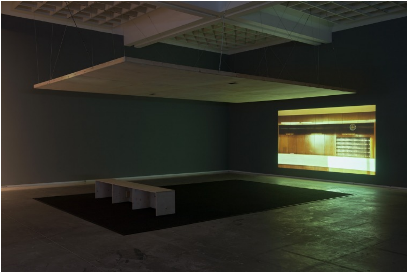
[5] ניר עברון, קשת מזרחית, 2009. מראה הצבה, מוזיאון תל אביב, 2016. עיצוב חלל: דן חסון.