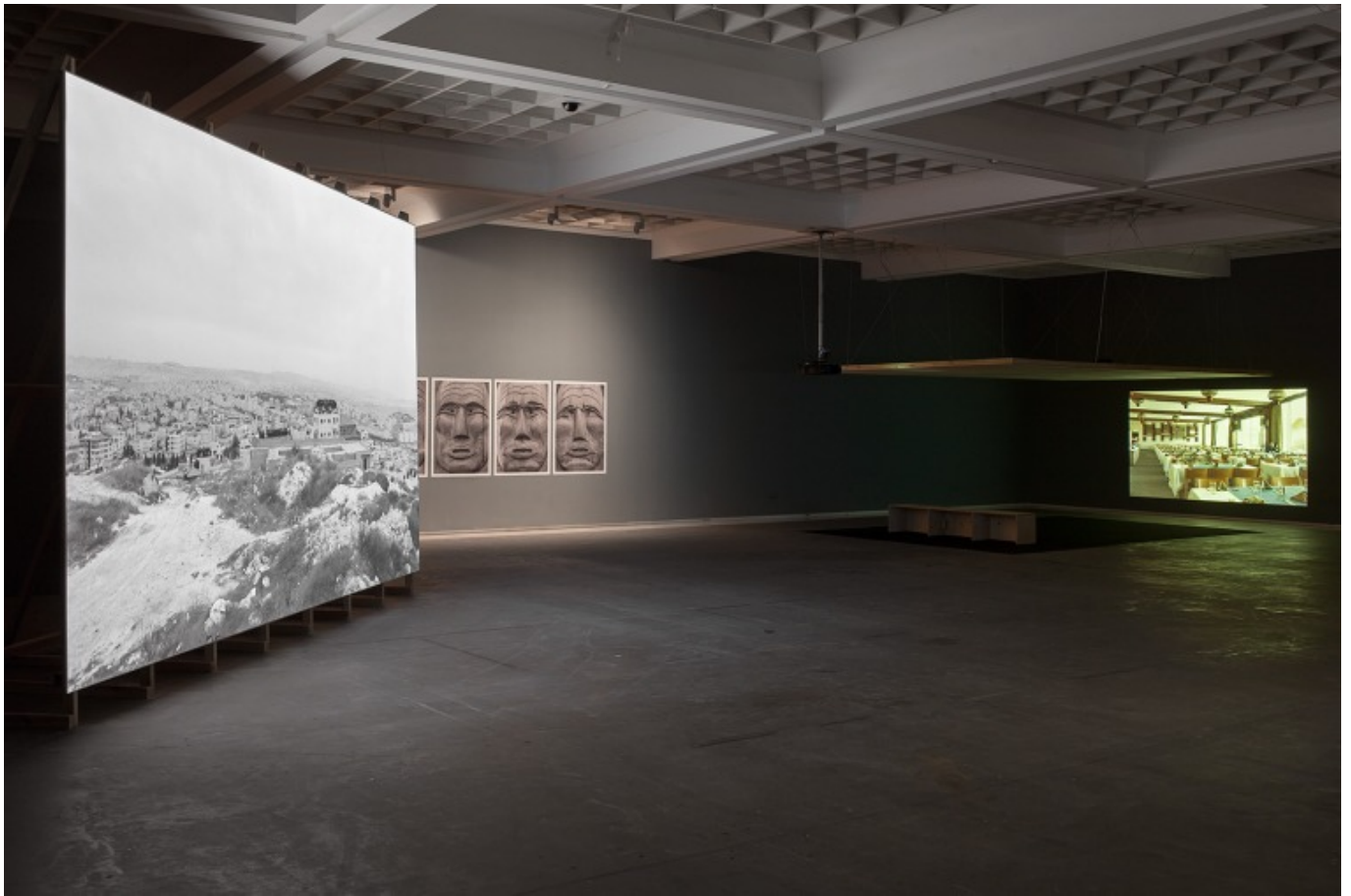
[1] ניר עברון, מסד, 2016. מראה הצבה, מוזיאון תל אביב, 2016. עיצוב חלל: דן חסון. צילומי הצבה: אלעד שריג

בכניסה לתערוכה תלויים תצלומי תקריב של פרצופי טוטמים מהתיישבות ג'יימסטאון (Settlement Jamestown) - מוזיאון היסטוריה חיה בוויירג'יניה שבארה"ב. בתצלומים אלה, מ-2016, לא נראים הבסיסים עליהם עומדים הפסלים, דבר שגורם להם לרחף - גם משום אופן תלייתם זה בצד זה לאורך הקיר. בעבודה אחרת בתערוכה - עבודת הווידאוקשת מזרחית מ-2009 - עברון מצלם במלון שבע הקשתות בהר הזיתים. המלון נבנה לפני שנת 1967 והוא פועל מאז במתכונת מצומצמת. הדימויים הנעים בעבודה מראים מקום ריק מאנשים ומפעילות. עברון מצלם בשוטמים סטאטיים או איטיים, ואופן ההסתכלות של המצלמה פסיבי. החיוניות שמאפיינת בתי מלון פעילים ושוקקי חיים - פעולות עובדי המלון ויחסיהם עם מבקרי המלון, אם מאחורי הקלעים או לפנייהם - חסרה כאן, והמקום נחווה כתקוע במרחב ביניים שבין פעילות לאי-פעילות, ובין קיומו המובהק לאי-קיומו. מרחב זה דומה במידה מסוימת לארמון הקיץ של משפחת המלוכה הירדנית, שמופיע בעבודה אחרת של עברון, שמוצגת אף היא בתערוכה, A Free Moment מ-2011. זהו וידיאו שמראה פיגומים סביב המבנה, שבנייתו הופסקה אחרי 1967. המצלמה מותקנת על מנגנון מרחף שאף מתהפך במאה שמונים מעלות ומדגיש כך את הטבע והנוף שמעבר לקירותיו הלא-בנויים של הארמון.