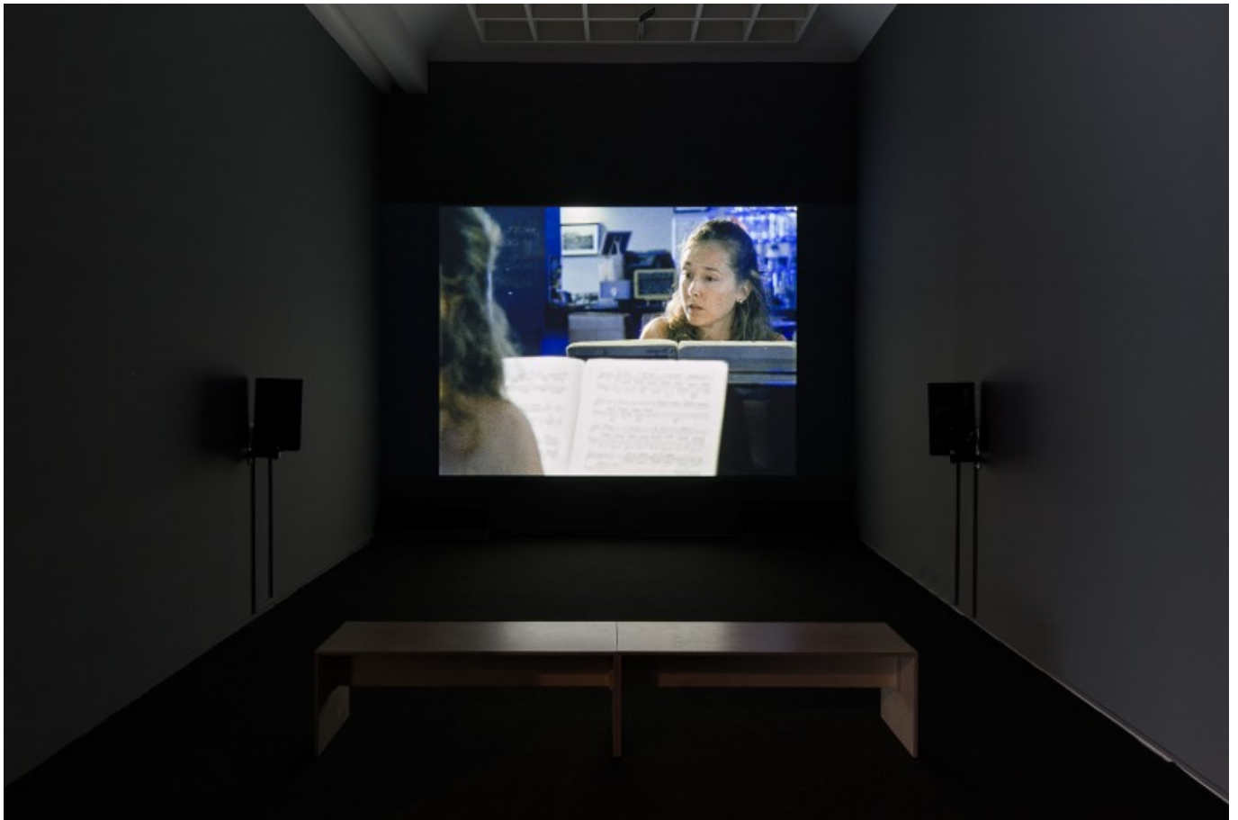
[17] ניר עברון, Solitude La, 2016. מראה הצבה, מוזיאון תל אביב, 2016. עיצוב חלל: דן חסון. צילומי הצבה: אלעד שריג

הדימויים שנוצרו בעזרת מצלמות ומחשבים, ועיבודם באופנים המדגישים את הניתוק מן היסודות הקונקרטיים (ההרחקה מן הקרקע, הריחופים, הטשטושים, מתיחת הזמנים, ערעור כוח הכבידה והתנאים האמפיריים, ריקון האתרים מהתכנים שמפעילים אותם בדרך כלל, מן האפיונים שלהם, מפרטיהם המזוהים ומן הפעולות האנושיות והחברתיות הקשורות אליהם), באים לידי ביטוי בצורות האסתטיות דרכן בחר עברון לתת משמעות למקומות ולאובייקטים עליהם הצביע. בנוסף לכך, הפרטים החיוניים שיוצרים את הקונטקסט האקטואלי עבור האתרים והסיפורים הללו אינם בנמצא, והאפקטים הרדוקטיביים, בנראותם האסתטית, מסיטים את תשומת הלב מן הנרטיב ההיסטורי.