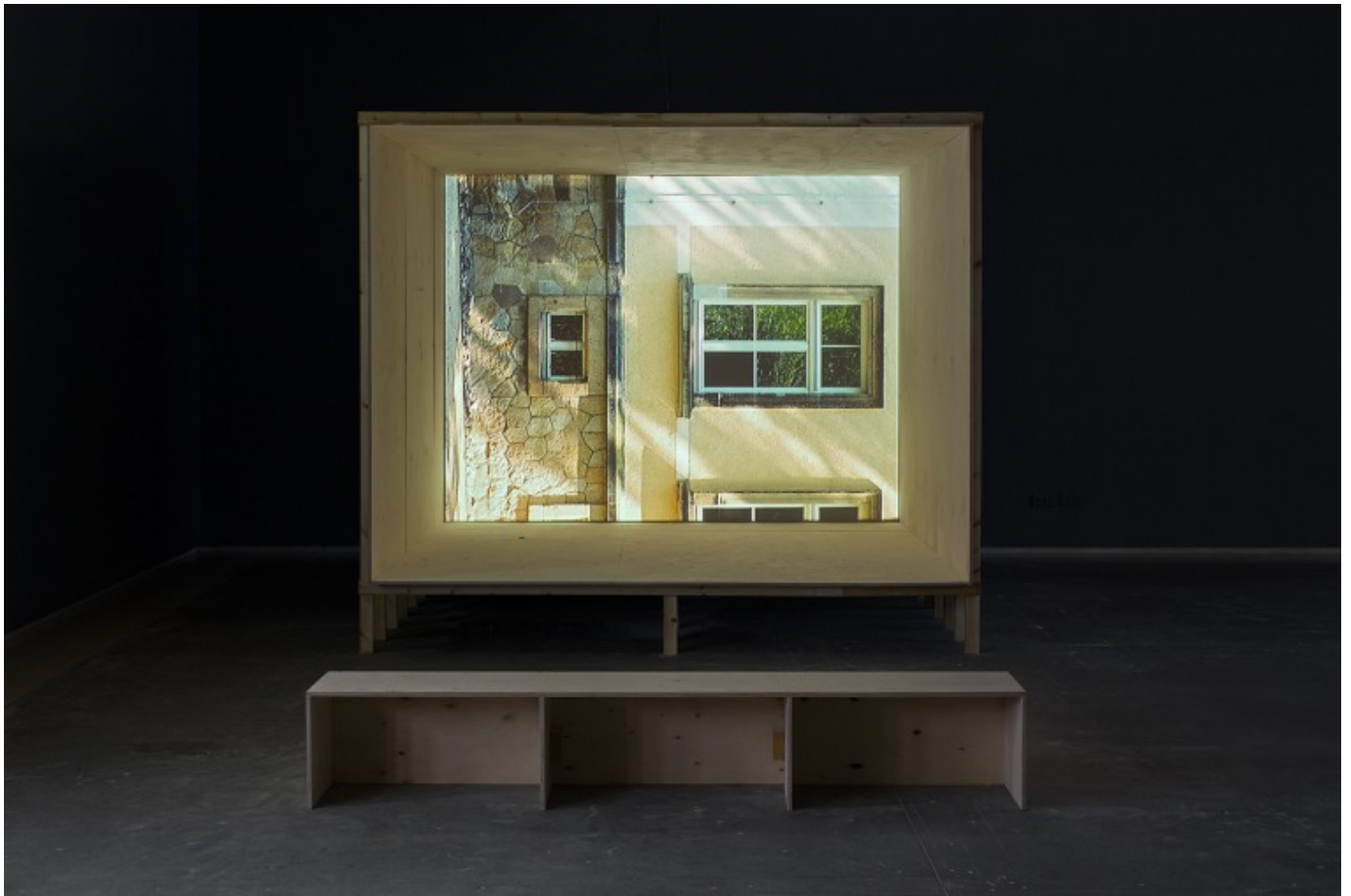
[11] ניר עברון, ברוח ודם, 2015. מראה הצבה, מוזיאון תל אביב, 2016. עיצוב חלל: דן חסון.