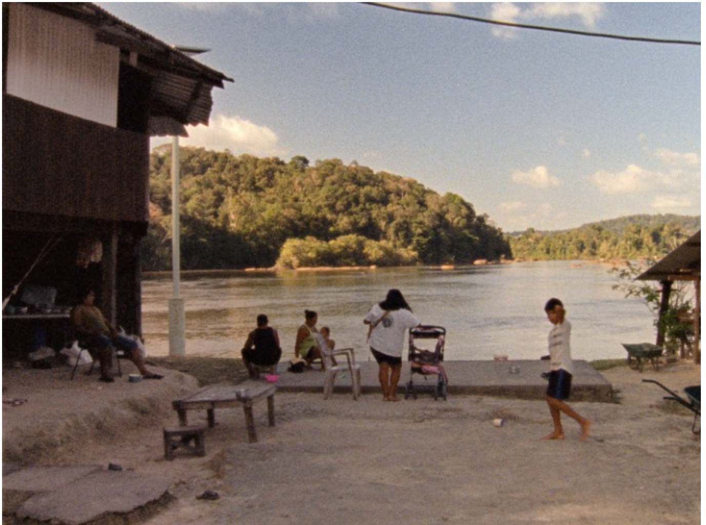
[15] ניר עברון, Solitude La, 2016. פריים מתוך וידאו. 2016