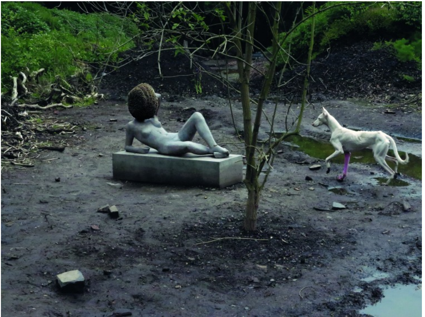
[9] פייר וויג, Untitled, 2011-12, באדיבות האמן, גלריית מריאן גודמן, גלריית האוזר ווירט וגלריית אסתר שיפר, ברלין.

אם הייתי יכולה להרחיב את טווח המבט של התערוכה ולצרף אליה עבודות שאינן ישראליות, הנוגעות לדעתי בשאלות של חקלאות, טריטוריה וביוגרפיה של בני אדם, הייתי מצרפת את הפרויקט המרתק של פייר וויג שבוצע בדוקומנטה 13 - אותה טריטוריה פתוחה, חציה חקלאית, חציה כפרית וטבעית, שמסתובבת בה כלבה, ומידי בוקר מגיע אליה גנן לטפל בה ולכוון את צמיחתה. עבודה זו כולה היא רגישות של מקום, צמיחה, גידולים, אדמה, ללא אדנות מסומנת. בתערוכת היחיד של וויג במרכז פומפידו בפריס (2015) הוא בנה את "מוריד הגשם" והענן מפיץ האובר, שקיבלו את פני הבאים במטח של גשם חזק, שהרטיב את רצפת חצר המוזיאון ושטף אותה במים נקיים. בעיני העבודה של וויג מהדהדת את "מפת משקעים" של הלר וחפץ ואת עיסוקה הבסיסי במים ויובש. בתערוכה המקיפה "צמחים כסוכנים פוליטיים" שהוצגה ב-PAV בטורינו, ב-2014, ייצגו הכותנה והקפה לא רק חומרי גלם צמחיים לייצור סחורות גלובליות, אלא גם היסטוריה של עבדות ושעבוד. תערוכות אלה מעידות על הסרת הלוט מעל האידיליה החקלאית, או במילותיו של ס. יזהר בשורות הסיום של "צלהבים": "אין עוד שדה. הלך השדה [...]. תם קסמו. נגמר." 5