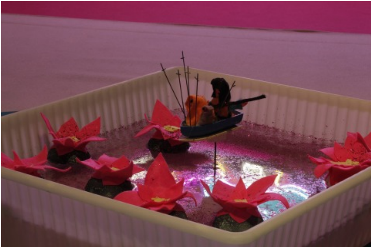
[5]מראה הצבה סלואולנד. גלריה ברבור, 2017