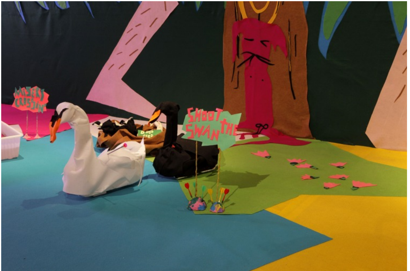
[7]מראה הצבה סלואולנד. גלריה ברבור, 2017