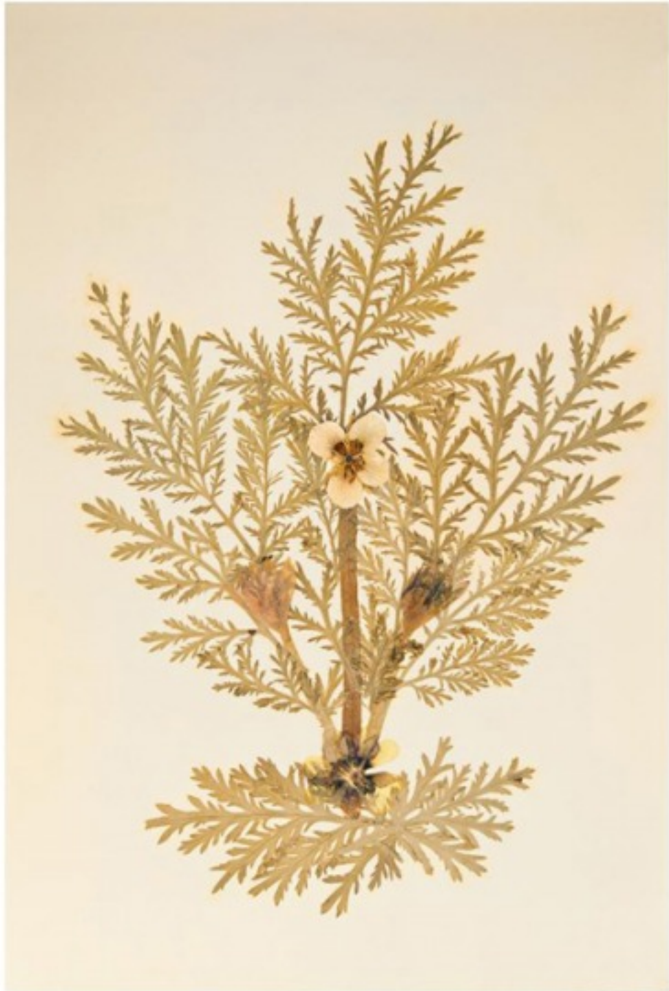
[7] אורית ישי, #2 1917, 2012, צילום סטילס הזרקת דיו ארכיבי על נייר ארט, 135 על 100 ס"מ