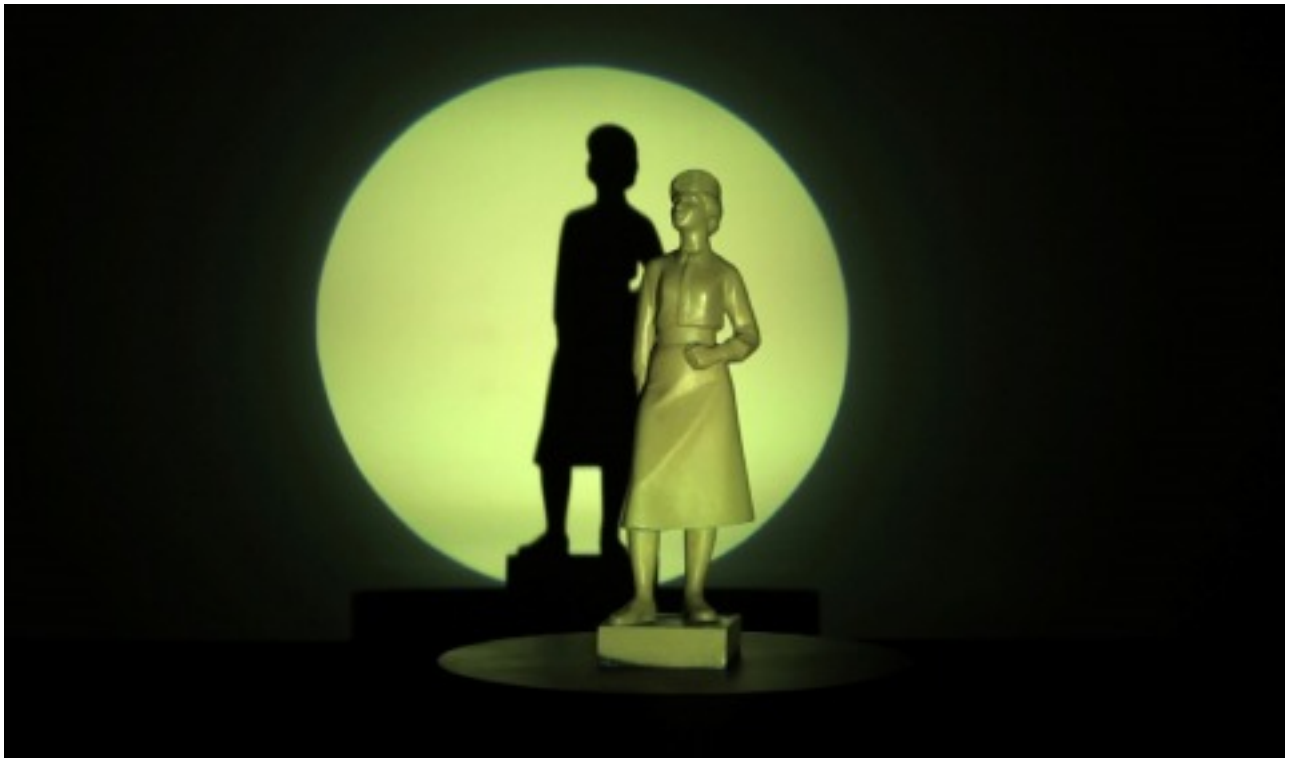
[11] אורית ישי, רגע לכוד מתוך הווידאו "מספר סידורי 2953", 2015 00:4 דקות, צבע, סאונד

בם יבשה אויר (2016) מוצגות מספר הדפסות ממוסגרות, שכל אחת מהן מציגה מלבן בצבע אחיד, בגוונים של בז', ירוק או תכלת ולבן, כשהם מונחים אופקית זה על גבי זה וממלאים את הדימוי. הגוונים מבוססים על צבעי מדי חיילות הצבא הישראלי שישו דגמה. בעבודה אחרת ריבועים זהים בגודלם המזכירים פיקסלים מוגדלים. הדימוי המקורי (מדי צבא בעלי מטען תוכני, פוליטי, קונקרטי והקשר אנושי, בעלי עושר חומרי שצבעוניותו הרבה קשורה במזג אוויר ונסיבות אחרות) עבר כאן רדוקציה קיצונית עד שהגיע למצבו הסופי שבו המקור החומרי נעלם ולא קיים אפילו לא כעקבה.