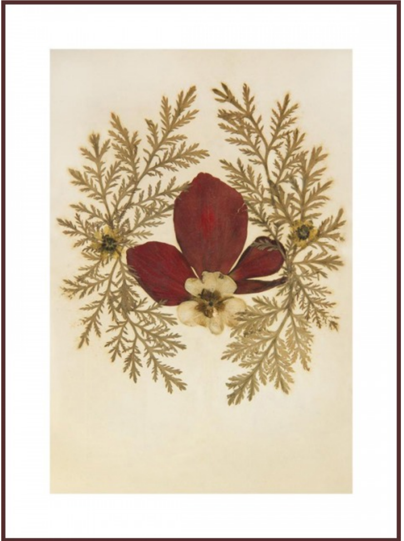
[9] אורית ישי, #1 1917, 2012, צילום סטילס הזרקת דיו ארכיבי על נייר ארט, 135 על 100 ס"מ