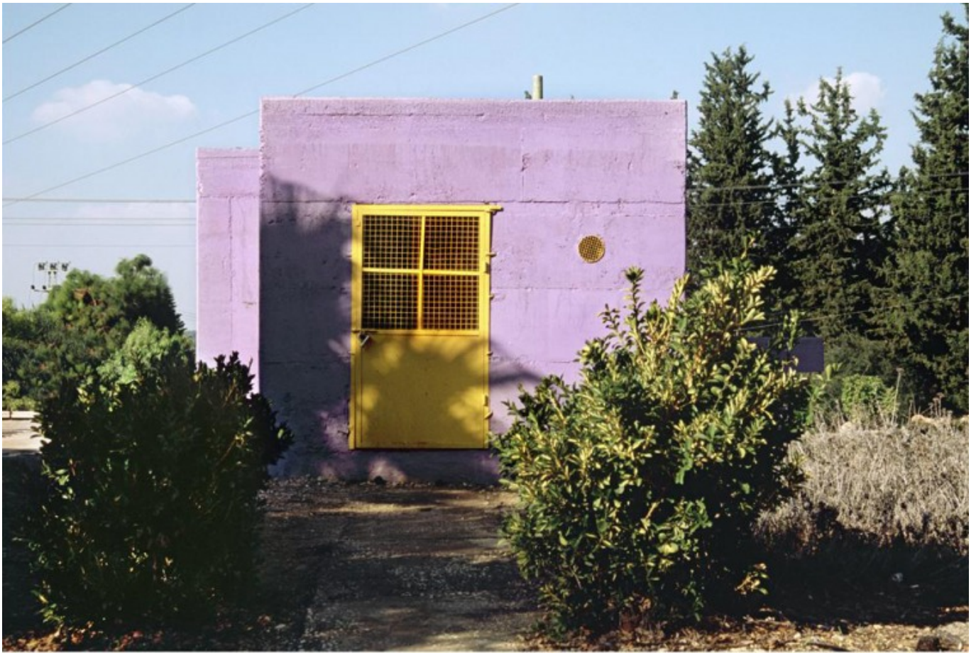
[19] אורית ישי, רשות הציבור, צלפון, 2007, צילום סטילס הדפס למבדה, 40 על 50 ס"מ

עוז 21 (2016) הוא וידאו שאורכו כ-15 דקות והוא מורכב משני אירועים המתרחשים בשני אתרים שונים בעיר ערד: בחלק הראשון מבצעות רקדניות מקומיות מעין מסדר צבאי ליד מבנה בטון ברוטליסטי בלב העיר, כאשר ברקע מוקרא קטע קצר מ"אל תגידי לילה" של עמוס עוז - ספר המספר על עיירה מדברית מרוחקת שנכתב בעת שעוז התגורר בערד. בחלק השני הריקוד חופשי יותר ומופשט, בשולי העיר, סמוך לפסל גדול מוקף מדבר, כשברקע נשמעים צלילי השיר "בדרך אל האור" בביצוע להקת גמלאי העיר. הכוראוגרפיה יוצרת תנועות אחידות ומכאניות. הדמיון הצורני המוקצן, שמזכיר מסדרים צבאיים, מייצר תחושה שהאינדיבידואליות של הרקדניות עברה רדוקציה והכללה. גם קטע הספר של עוז משובש ומוקרא באופן מקוטע בהפוגות שוות בין מילה ומילה, דבר שיוצר אפקט רובוטי ומנטרל את העושר התיאורי שמאפיין בדרך כלל את כתיבתו של הסופר. הפעם, במקום פגיעה ברזולוציה הדימוי של הווידאו, או בניראותו, דווקא הפעולה של הרקדניות, המכאניות והעלמת הייחוד מטשטשות את האינפורמציה הקונקרטיה, כך שבמקום ערד אנחנו מקבלים "כל מקום", ובמקום אינדיבידואלים - קבוצה של פרטים זהים וחסרי ייחוד.