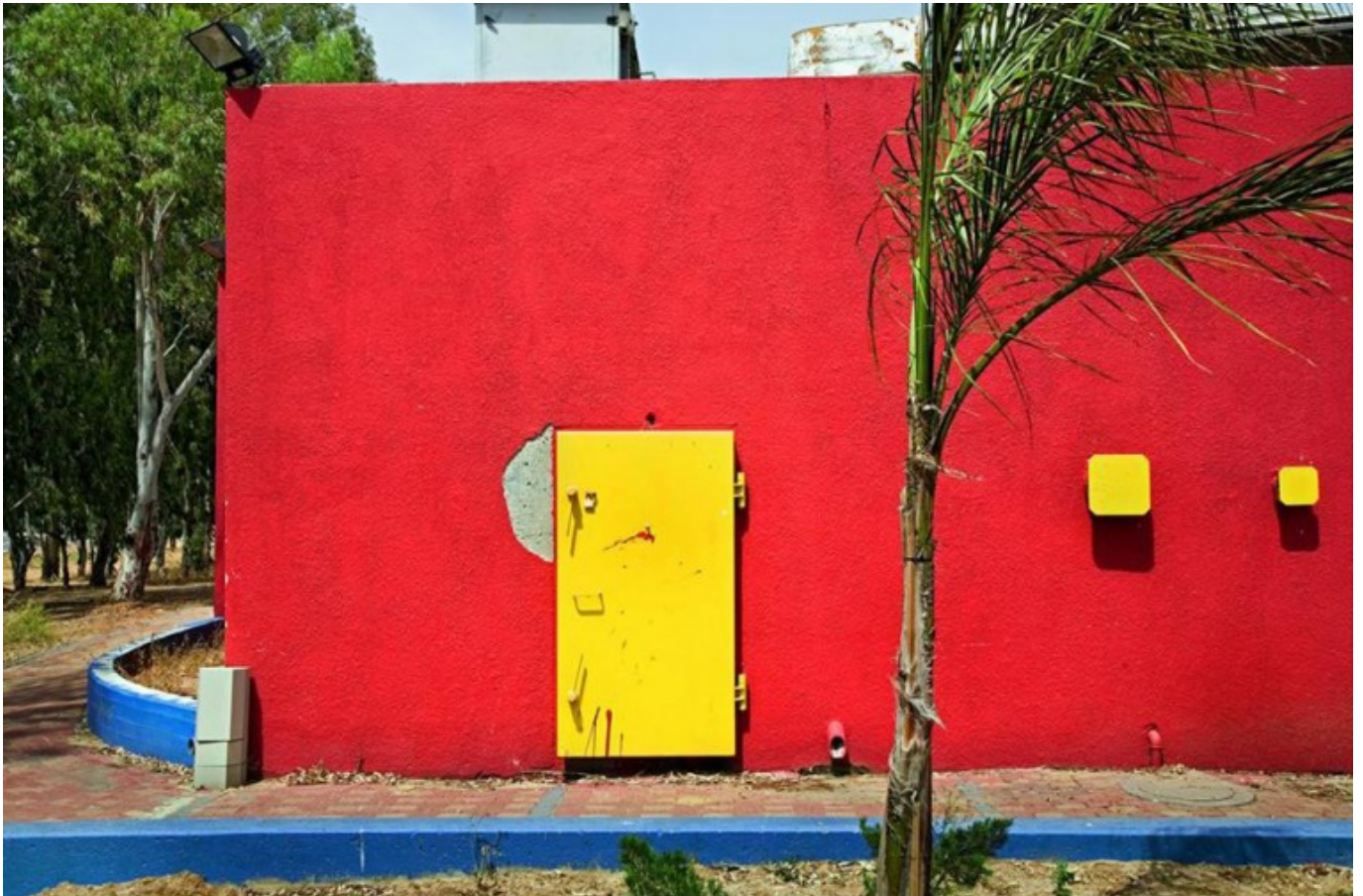
[17] אורית ישי, רשות הציבור, שדרות. 2008, צילום סטילס הדפס למבדה, 40 על 50 ס"מ