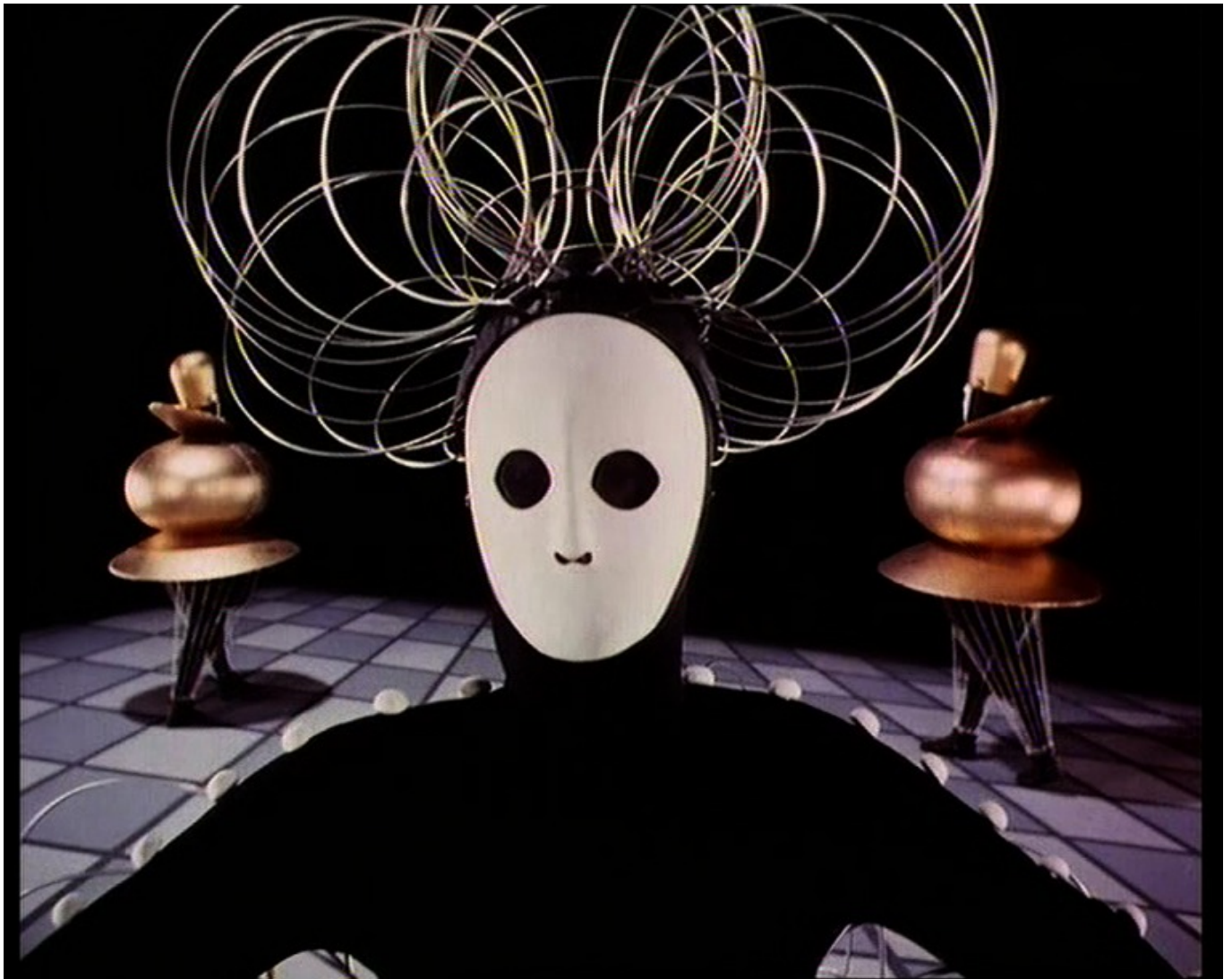
[5] אחרי אוסקר שלמר, בלט בשלישיה Ballett Triadische Das, 1970, סרט 35 מ"מ משועתק לווידאו, צבע, קול. 29 דקות