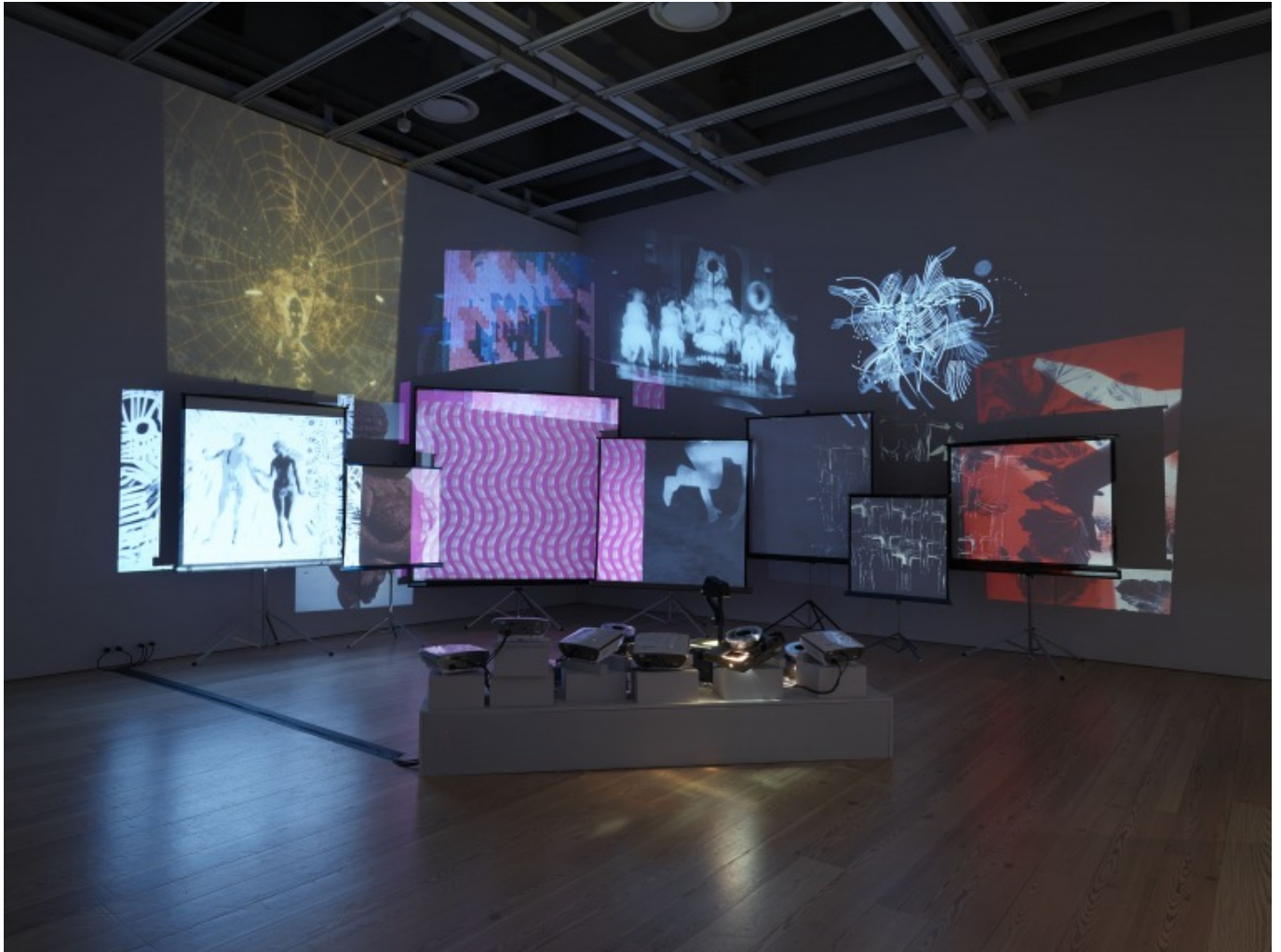
[7]סטן ונדריביק, 2016.1545.E (1968) Mural Movie, מבט הצבה, "מחוזות החלום: קולנוע ואמנות אימרסיביים, 1905-2016"

צילום: רונלד אמשטוץ מוזיאון וויטני לאמנות אמריקנית, ניו יורק. 28.10.2016 - 5.2.2017