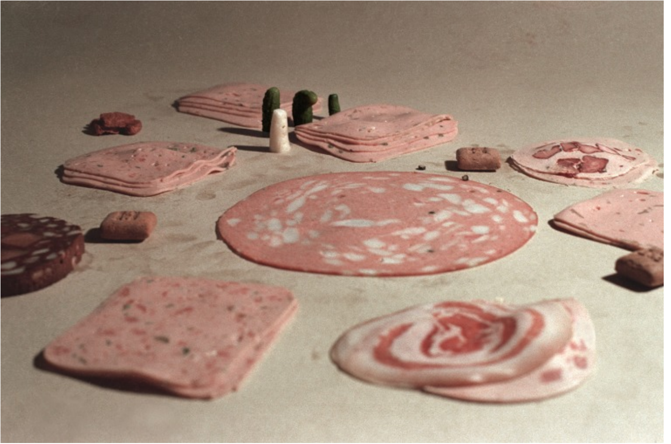
[9] بيتر فيشلي وديفيد فايس. في دكان السجاد (من سلسلة النقانق). 1979، طباعة ملونة 24*36 س مركز ووكر للفنون، مينيابوليس، صندوق اقتناء كلينتون ودالا ووكر، © 1993 2015 بيتر فيشلي وديفيد فايس

لا يحدد الفنان فروقاً وتميزات، لا بين الجميل والتافه ولا بين ما له معنى وما لا معنى له. لا يمكن تشخيص أيًا من الفنانين هو مؤلف العمل المحدد، وفي المشاريع المستمرة على مدى زمني، لا تبدو ولو سنة واحدة مختلفة عن السنوات الـ33 الأخرى. ما هو موجود هو الموجود. وفقاً لفرديريك نيتشه، هذا هو مفهوم الزمن عند الحيوان، الذي يعيش الحاضر بطمأنينة النسيان المبارك. يعرض فيشلي-فايس كينونة حيوان كهذا في عملهما الذي يشتمل على حشد من القطط، الكلاب، الخنازير، الخرفان، وحيوانات مختلفة كثيرة أخرى. وفي حين أن "الجرذ" و "الدب" يطلان في كل مكان بنيويورك من خلال المنشورات الخاصة بالمعرض، فإن بوسي (بسيوس) (Kitty) Büsi (2001)، كان يلحق الحليب على شاشات ضخمة في ساحة تايمز عند كل منتصف ليل على امتداد شهر شباط.