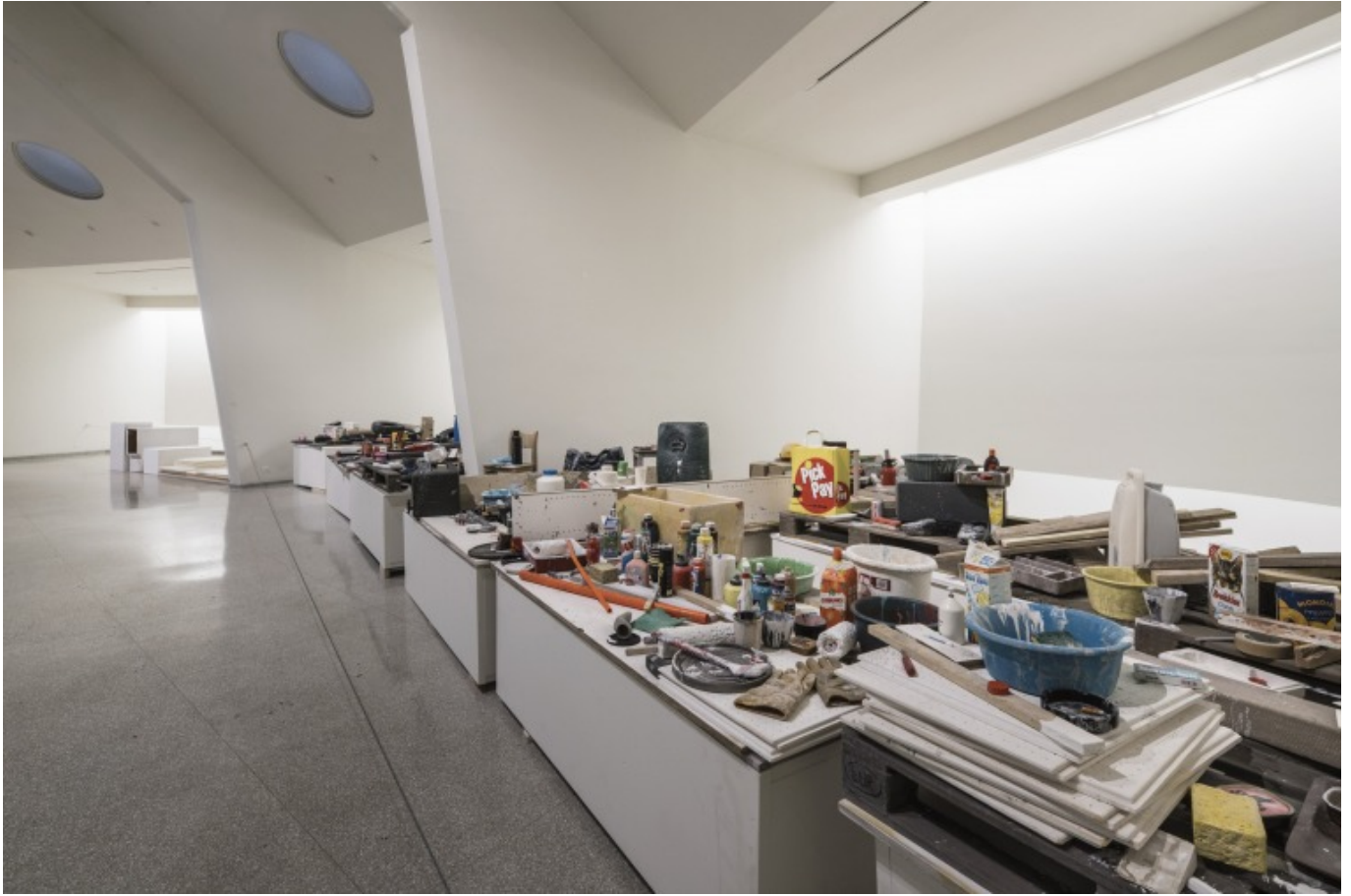
[5] منظر تركيب: بيتر فيشلي وديفيد فايس: كيف نعمل أفضل 2016