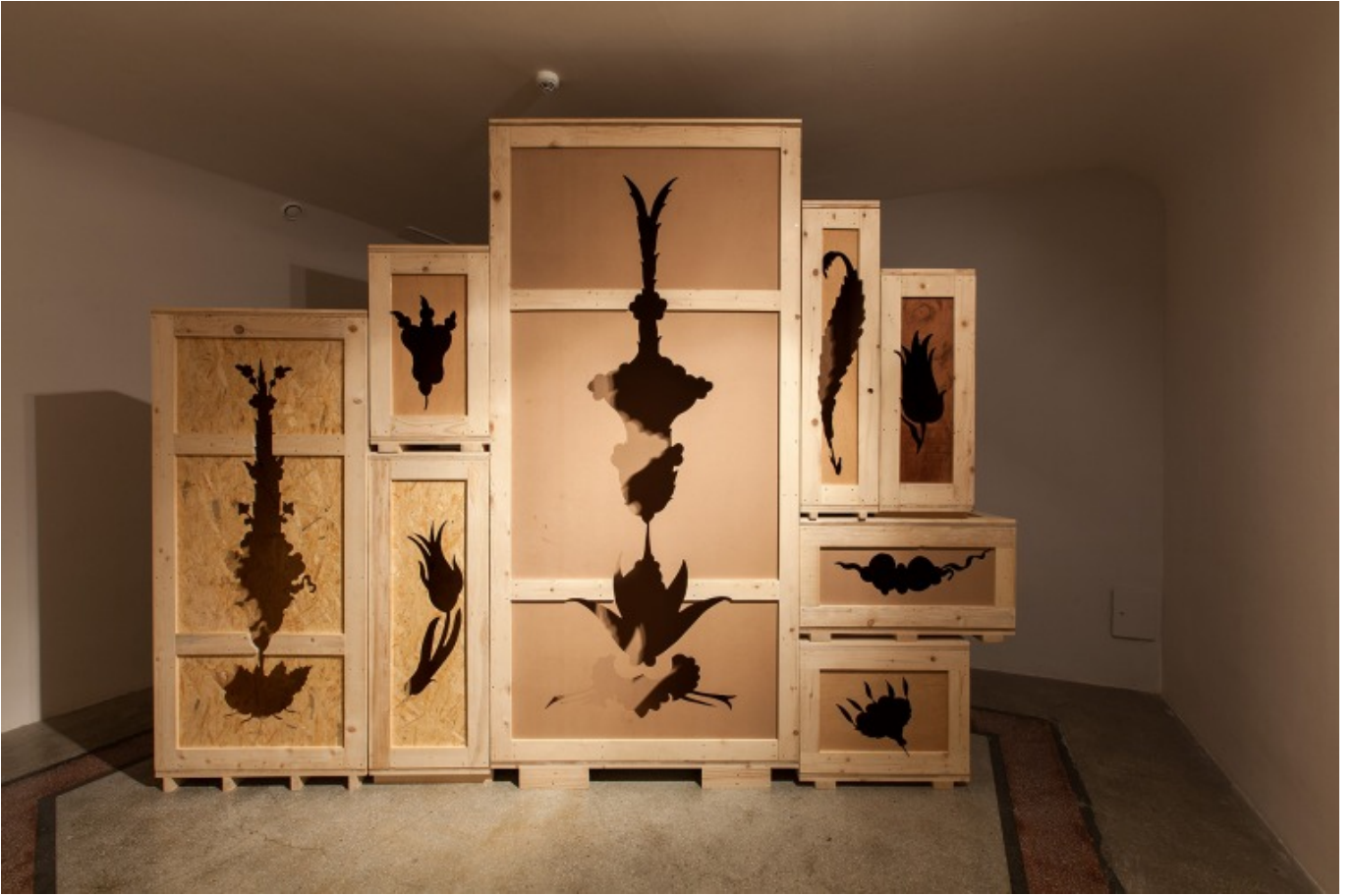
[1] وليد رعد، رسالة اخرى للقارئ 2015، تصوير Eren Ugur Sahir بلطف IKS