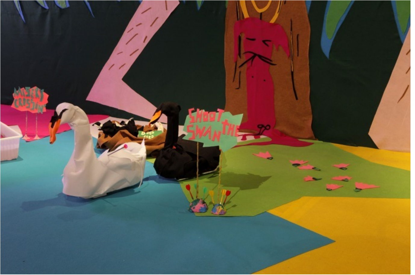
[9] منظر للتركيب Slowland ، بربور جاليريا ، 2017