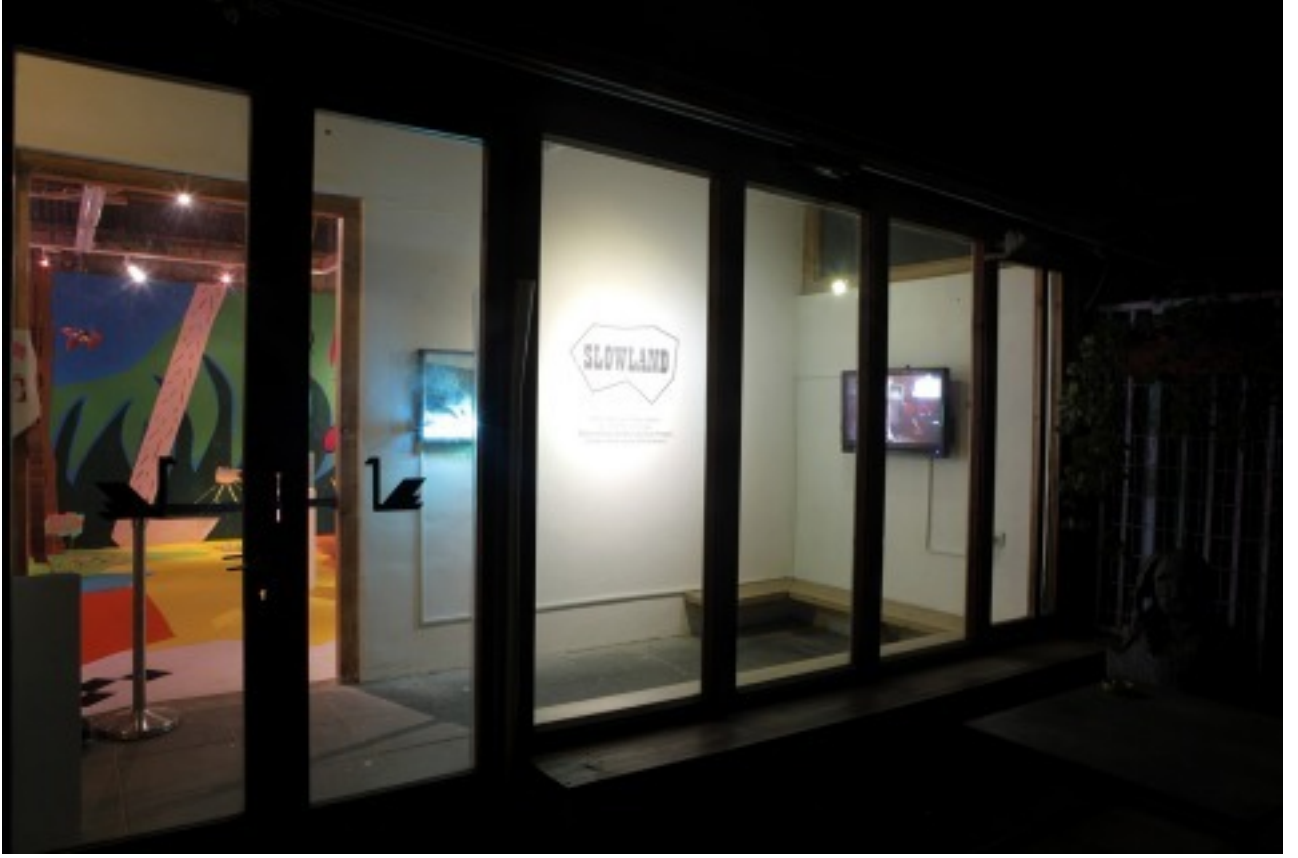
[17] منظر للتركيب Slowland ، بربور جاليريا ، 2017