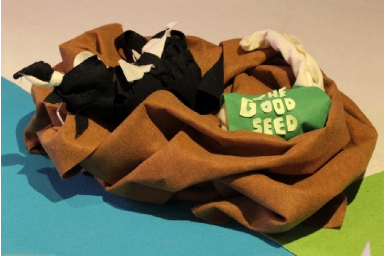
[5] منظر للتركيب Slowland ، بربور جاليريا ، 2017