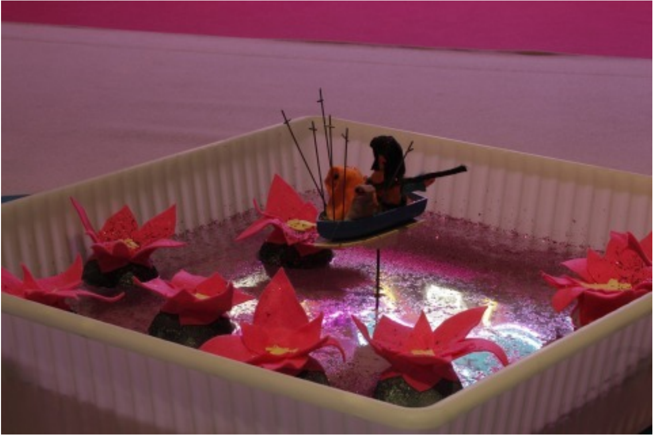
[7] منظر للتركيب Slowland ، بربور جاليريا ، 2017