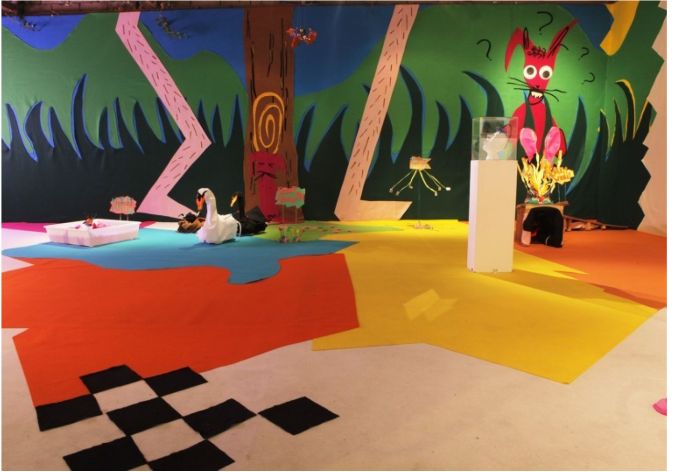
[1] منظر للتركيب Slowland ، بربور جاليريا ، 2017