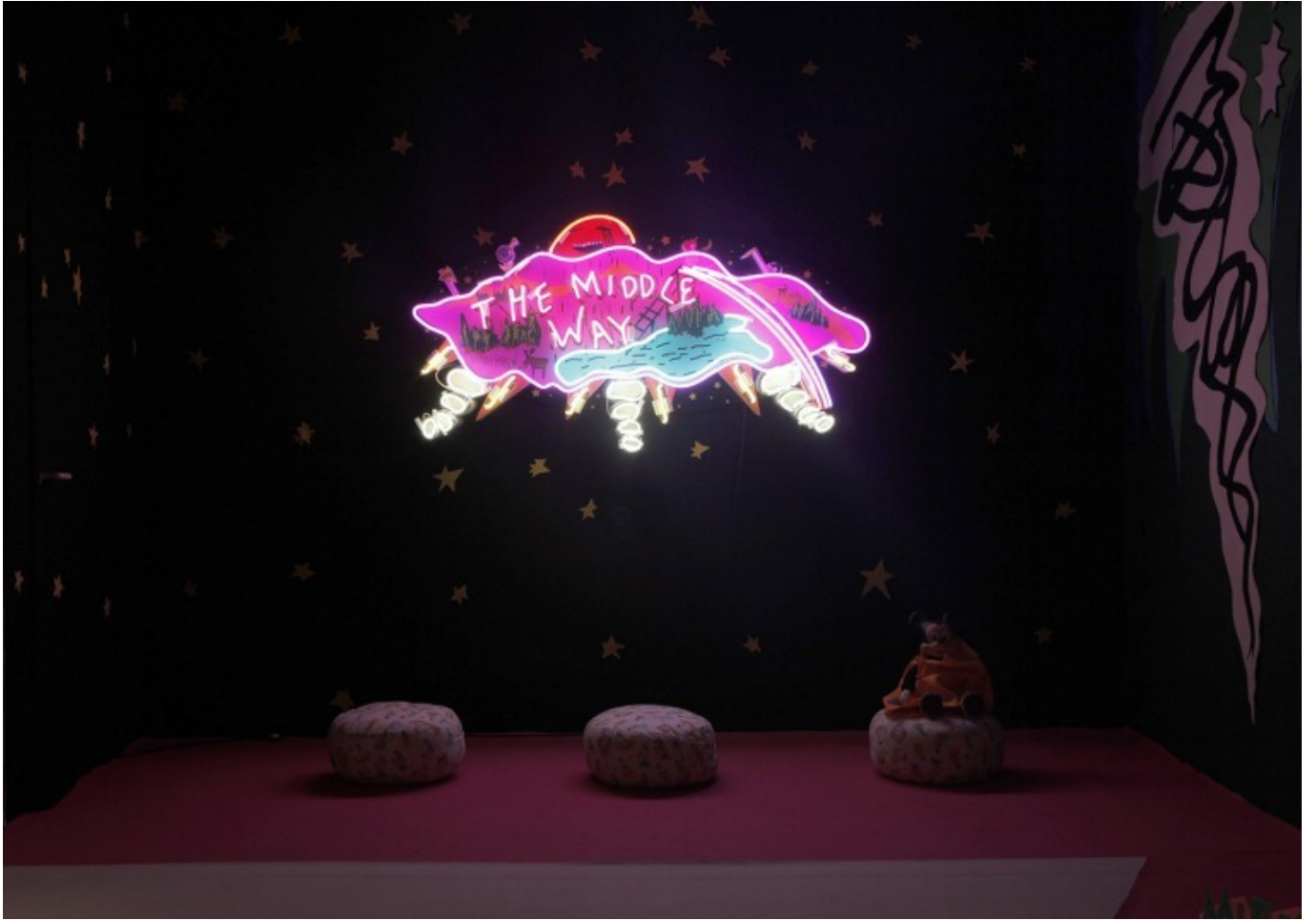
[3] منظر للتركيب Slowland ، بربور جاليريا ، 2017